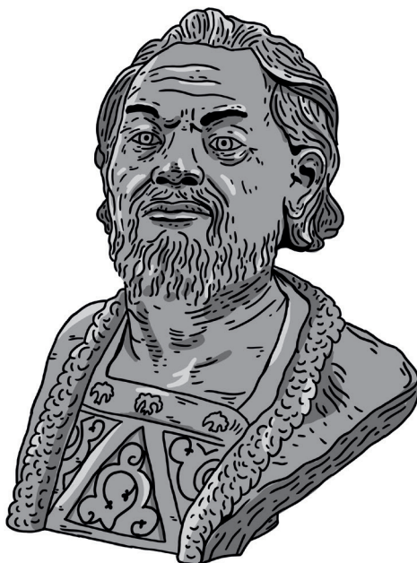
4. kép. Andrej Bogoljubszkij egyik lehetséges portréja. Molnár Roland rajza Mihail Geraszimov antropológus mellszobrának felhasználásával

Végül a szerző az évkönyvek másolóinak, ill. összeállítóinak szemléletével kapcsolatban még két figyelemre méltó megállapítást tett: Andrej Jurjevicsnek a hagyományokkal való határozott szakítását a 15–16. században a könyvekkel foglalkozó emberek (knyizsnyiki) is észrevették. A fejedelem tetteiben ők az orosz történelem új szakaszának kezdetét látták, annak a szakasznak a nyitányát, amelyhez saját időszakukat is sorolták. Igaz, közvetlen mérföldkönek, amelytől az orosz történelem új szakasza kezdődött, különféle eseményeket jelöltek meg, és nem feltétlenül Kijev tönkretételét. A 12. század krónikása, a kijevi pusztítás kortársa azonban csak a megszokott fejedelemváltást konstata: „Gleb fejedelemségének kezdete Kijevben”. 34