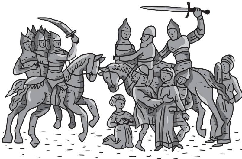
3. kép. A győztesek foglyokat ejtenek Kijevben 1169-ben. Molnár Roland rajza a Radziwill-évkönyv miniatúrája alapján

állítja, hogy miután a kijevi fejedelmek a vlagyimiriak podrucsnyikjai lettek, az egyeduralom Bogoljubszkij alatt Kijevből Vlagyimirba került át, s a történetudományban éppen ezt a 16. század közepén létrejött koncepciót fogadták el kritika nélkül. 21