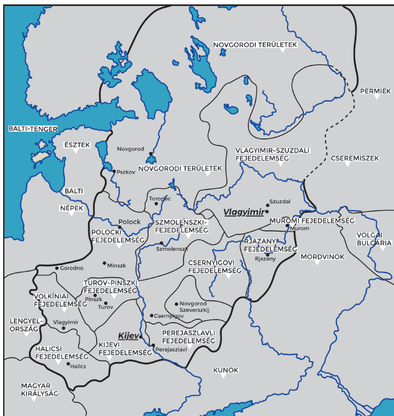
2. kép. A Kijevi Rusz a 12. század második felében.