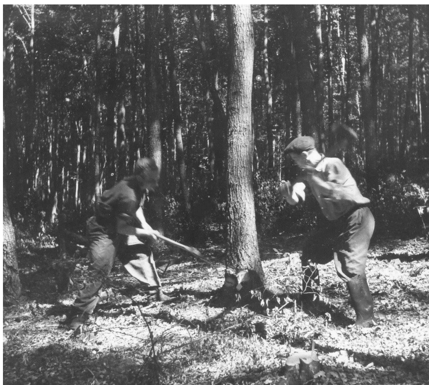
6. kép. Fakivágás a gyöngyössolymosi erdőben. 1956. Bakó Ferenc felv.

A birtokosságok gondoskodtak az erdészeti hivatal által évente engedélyezett fa kivágásáról és szétosztásáról. A tagok a közös erdőből jog, erdőjog, illetőség, illetmény alapján részesedtek, de a régióban hívták még résznek, részaránynak, nyolcadnak is. A legelőjoghoz hasonlóan eredetileg a szántóföldhöz, a telki állományhoz tartozott, s egy-egy gazdának a birtoka nagysága után járó eszmei tulajdonrészt jelentette az osztatlanul közösen birtokolt erdőből. Az Északi-középhegység falvaiban általában egynyolcad telek után kaptak egy erdőjogot. A Zempléni-hegységben fél kvárta (3 kat. hold), a Palócföldön fél fertál , Diósgyőrben egy ráta föld (2,5 kat. hold) után kaptak egy illetőséget. 21 A közbirtokosságok nyilvántartották az erdőjogokat. Felsőtárkányban 1935-ben 352, 1943-ban 368 illetőségről írnak a jegyzőkönyvek. A Zempléni-hegyvidéken az újhutai közbirtokosságnak 1978-ban 18 tagja volt 12,5 joggal, a regécinek 1957-ben 68 tagja 132 erdőjoggal. 22 Az erdőjog is örökölhető és eladható volt, így sok töredékjog keletkezett, amit úgy kezeltek, hogy ha faosztáskor többen voltak egy erdőjog fájára, akkor faosztás után tovább osztozkodtak az egy köbméternyi fán. A közbirtokosság tagjai az erdőjog mértékében húztak sorsot ( nyilhúzás ), és ez alapján vágták ki a tagok a nekik jutott erdőrészt ( nyilas, parcella ), megjelölt élőfát, vagy vitték haza a favágókkal kivágatott és méterbe, rakásba halmozott fát. 23 (6. kép)