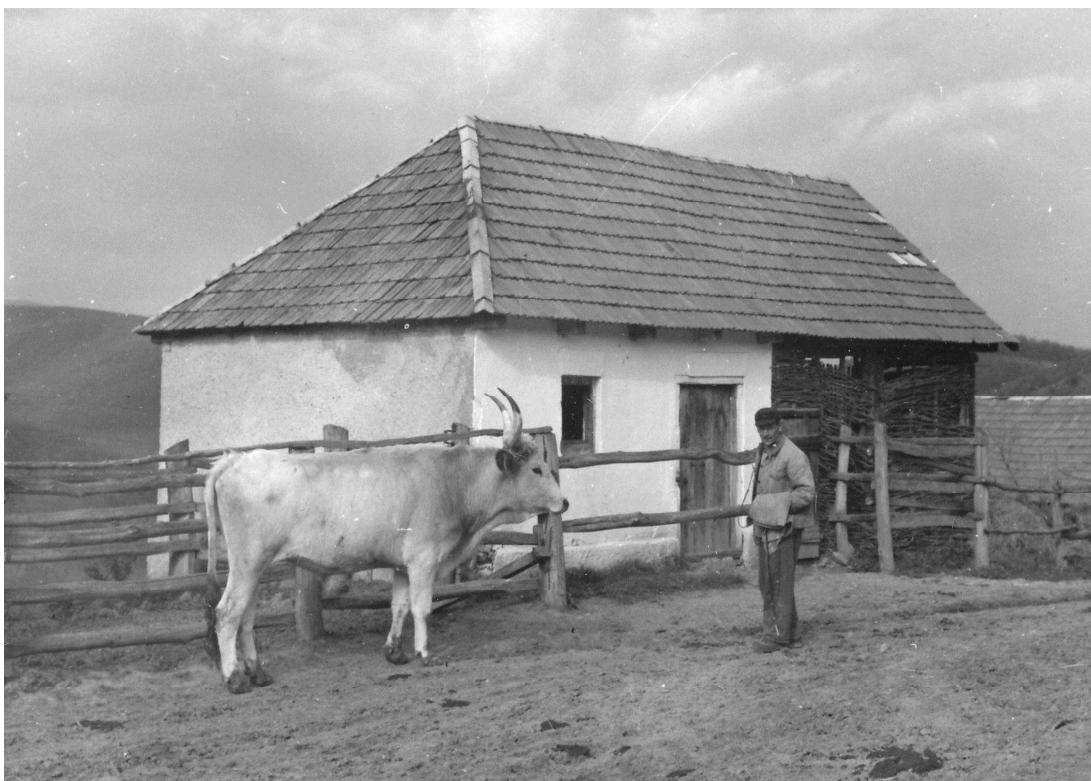
5. kép. Bikaistálló Szarvaskőn. 1959.