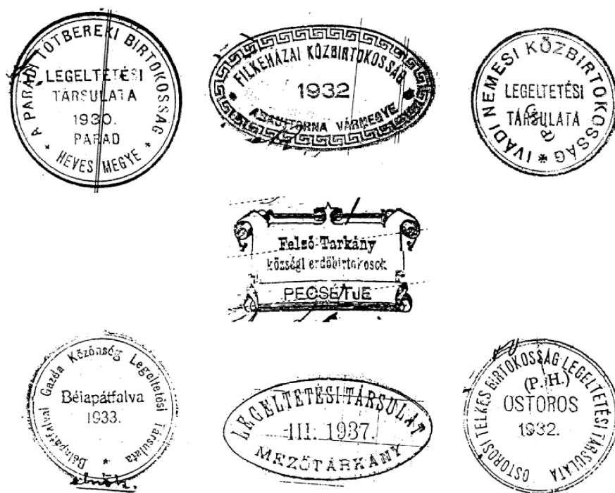
1. kép. Közbirtokossági pecsétnyomatok

A 19–20. század fordulóján a régió falvaiban már mindenütt működött a közös erdő- és legelőhasználatot szabályozó szervezet, helyi elnevezésekkel birtokosság, úrbéres birtokosság, volt úrbéres birtokosság, közbirtokosság . Az 1913. évi X tc. alapján az első világháború miatt csak az 1920-as évek második felétől alakultak át ezek a szervezetek legeltetési társulatokká , majd az 1935. évi IV. tc. szerint erdőbirtokosságok, erdőbirtokossági társulatok is alakultak. 10 (1. kép)