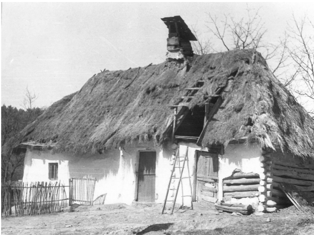
4. kép. A filkeházi pásztorház az 1970-es években.