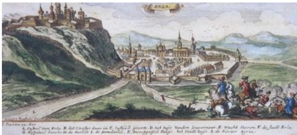
1. kép: A Cifra kapu Gaspar Bouttats: Eger északról, 1684. metszeten. Dobó István Vármúzeum Legújabbkori Dokumentumok (DIV LUK DOK.) 2001. 2. 1

tében is olvashatunk a „megbízhatatlan hitelességű metszetek”-ről, amit csak erősít, hogy mindegyik metszeten a patak jobb oldalán található a kapu és tőle balra a patakon átívelő, kétnyílású híd. 10 Az Eger patak bal partján fekvő káptalani városrészből az egykori Káptalan utcának a Cifra kapu volt az egyetlen északra vezető kijárata. Ez csakis a mai Cifrakapu utcában folytatódhatott, tehát a metszeteken látható kapu csak a pataktól balra épülhetett, pontosan fordítva, mint ahogy a metszeteken látszik. (1. kép)