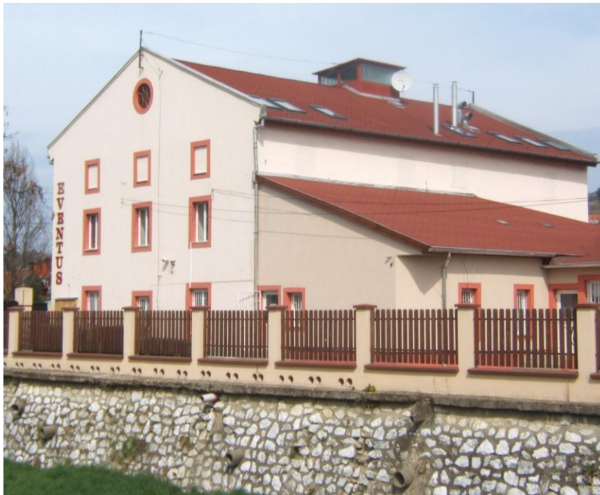
6. kép: Az egykori Cifra malom, Práf-malom, a mai Eventus Szakképző Iskola épülete. 2012. június 12.

A Cifra hóstya nevezetes ipari épületei voltak a malmok és a püspöki tégláégető. A Cifra malom , Práf-malom a Malom árok és az Eger patak találkozásánál épült és már a 18. század végi térképen is szerepelt. A Práf-malom még az 1920-as években is vízimalom volt, az épületében működik ma az Eventus iskola. (6. kép)