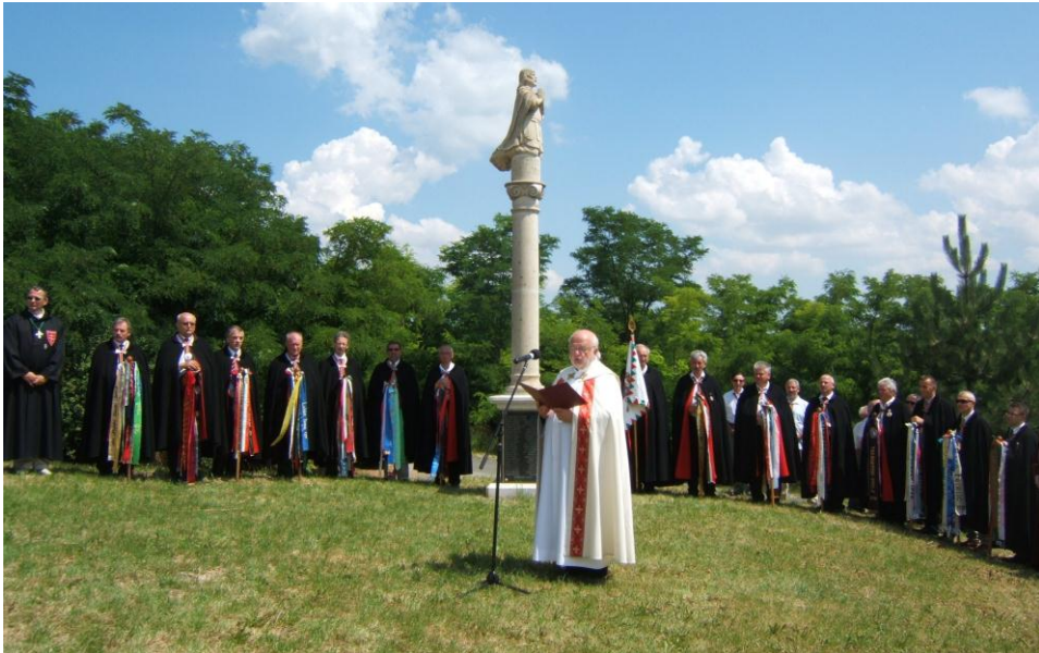
9. kép: A Szent Donát szobornál tartott könyörgés fertálymesterekkel.