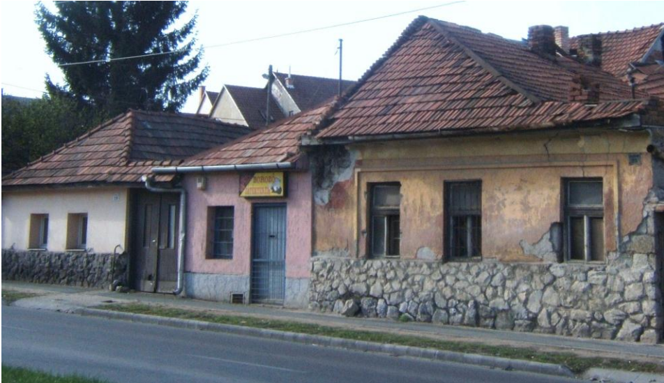
4. kép: Régi házak a Tetemvár utcában. 2012.

A hóstyai lakóházak az utcafronton általában zárt sorú beépítésűek, illetve szűk udvarokon rendezetlenül álltak. (4. kép)