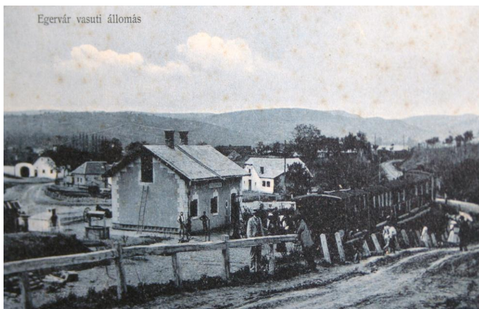
7. kép: A Várállomás és vonat a 20. század elején. DIV Történelmi Képeslapgyűjtemény (TK)

A mai Kallómalom utca örzi az Eger patakon működött kallómalomok emlékét, amelyeken az egeri csapók és posztókészítők tömörítették az alapanyagot. 38 Az egeri püspökség állandó téglagyára a Noszvaj felé vezető út mentén, a Vécssey-völgy északi oldalán volt, és a helyben bányászott kiváló minőségű, alsó oligocén kori agyagra épült. 1695-től működött, amelyet az 1783-as katonai felméréskor készített térképen is feltüntettek. 1799-ben az üzem már évi 50 000 téglát előállítására volt képes. 1851-ben a 42 440 falba való téglát és 3860 burkolótégla mellett 600 cserépszindelyt is gyártottak az üzemben. Az EA téglajegy az Episcopatus Agriensis rövidítése. 1938–39-ben 2,6 millió téglát és cserepet készítettek itt. A gyárat 1949-ben államosították, és az átszervezések után az 1980-as évekig működött. 39 Az Eger-Putnok vasútvonal 1908-ban készült el, amelyen egy vasúti megálló is létesült, a Várállomás . (7. kép)