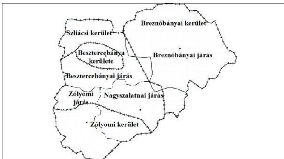
Zólyom vármegye választókerületi és járási beosztása, 1900

Mint az a térképen is látható, a megye választókerületi beosztása nem esett egybe a járási beosztással. Besztercebánya – választókerületként – a városon kívül magába foglalt még 7 járási települést. A breznóbányai kerületben választott 5 besztercebányai járásba tartozó település is. A szliácsi kerületben 43 besztercebányai, 5 nagyszalatnai és 14 zólyomi községből adódtak össze a szavazatok. A zólyomi mandátumért pedig 15 zólyomi és 10 nagyszalatnai község, és Zólyom városának bizalmát kellett megszerezni. A fenti térképen úgy látható, hogy a nagyszalatnai járás keleti része a breznóbányai választókerülethez tartozik. A korabeli választási térkép 23 alapján készített kerületi térképem tehát eltérést mutat az 1899-es törvény alapján összeállított kimutatástól. Statisztikai vizsgálatomban a kérdéses területet a vármegye által készített beosztás szerint vizsgáltam, hiszen feltételezhetően Fodor Ferenc térképrajzoló követte el azt a kisebb hibát, ami csupán a terület községsoros azonosítása során fedezhető fel.